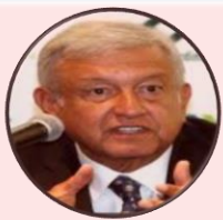
AMLO México 2018