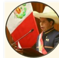
Pedro Castillo Perú 2021