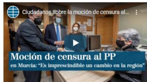
Ciudadanos sobre la moción de censura al PP en Murcia: "Es imprescindible un cambio en la región" EL MUNDO (Video)

La iniciativa ha sido registrada esta mañana en la Asamblea autonómica. Ha sido negociada por las direcciones nacionales y cuenta con el aval e impulso de Moncloa.